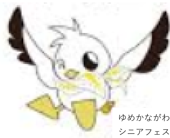
ゆめかながわ シニアフェスタ キャラクター